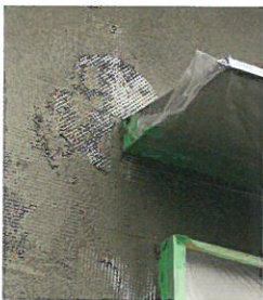
角にぴったりと合わせる事が可能