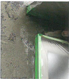
扉と窓の間にも簡単に作業できる