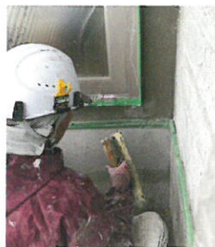
壁との間が狭くても施工可能