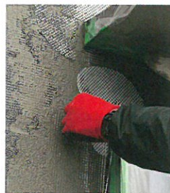
貼りつきも良く、作業効率が良い